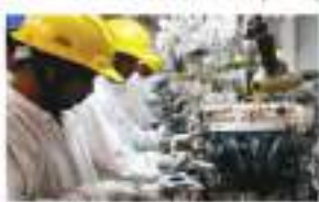
सेवा क्षेत्र की गतिविधियां सात महीने के निचले स्तर पर, उत्पादन और मांग में नरमी से आई गिरावट

नई दिल्ली। भारत के सेवा क्षेत्र की गतिविधियां अक्टूबर, 2023 में सात महीने के निचले स्तर पर आ गईं। प्रतिस्पर्धी स्थितियों व मूल्य दबावों के बीच उत्पादन और मांग में नरमी से यह गिरावट आई है। जारी मौसमी रूप से समायोजित एक्सटेंडिबल ग्लोबल भारत सेवा पीएमआई कारोबारी गतिविधि सूचकांक अक्टूबर में 58.4 पर आ गया। यह सितंबर में 13 साल के उच्चतम स्तर पर 61 पर पहुंच गया था। एक्सटेंडिबल ग्लोबल मार्केट इंटेल्जेंस में अर्थशास्त्र की एसोसिएट निरेशक पॉलियाना खी लोमा ने कहा, कई कंपनियों ने अपनी सेवाओं और प्रतिस्पर्धी स्थितियों की धीमी मांग को लेकर चिंता व्यक्त की। पीएमआई का 50 से अधिक रहना गतिविधियों में विस्तार और इससे नीचे का आंकड़ा गिरावट का संकेत है? लोमा ने कहा, अक्टूबर के आंकड़ों में सितंबर, 2014 के दौरान श्रृंखला शुरू होने के बाद से भारतीय सेवा कंपनियों को मिले अंतरराष्ट्रीय अर्थव्यवस्था में दूसरी सबसे तेज वृद्धि दिखी है। कंपनियों ने एशिया, यूरोप व अमेरिका के ग्राहकों से लाभ होने का उल्लेख किया। उभर, भोजन, ईंधन और कर्मचारियों की उच्च लागत से कंपनियों के खर्चों में तेजी आई।