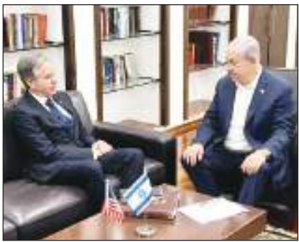
तेल अवीव में अमेरिकी विदेश मंत्री एंटी ब्लिंकन ने इजराइली पीएम नेतन्याहू से मुलाकात की।