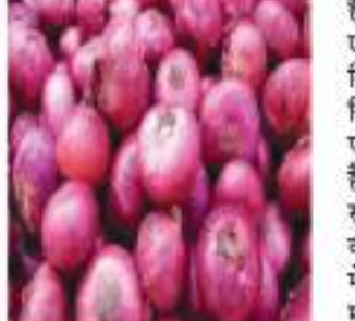
त्योहारों पर कीमतों को नियंत्रित करने की कवायद, बाफर स्टॉक से एक लाख टन प्याज बेचेगी केंद्र सरकार

एनसीसीएफ- भारतीय राष्ट्रीय सहकारी उपभोक्ता महासंघ (एनसीसीएफ) ने कहा, वह दिल्ली और आसपास के क्षेत्रों के अलावा जम्मू-कश्मीर से लेकर केरल तक सभी राज्यों में 25 रुपये प्रति किलोग्राम की रियायती भाव पर प्याज बेचेगा। इसका मकसद उपभोक्ताओं को प्याज की ऊंची कीमतों से राहत दिलाना