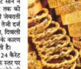
घरेलू सर्राफा बाजार में उछला सोना, दिल्ली में कीमत 62 हजार के करीब

नई दिल्ली/कोलंबो। एक दिन की सुस्ती के बाद आज एक बार फिर देश के सर्राफा बाजारों में सोने ने तेजी का रुख दिखाया। ज्यादातर सर्राफा बाजारों में 24 कैरेट सोने ने 150 से 200 रुपये प्रति 10 ग्राम तक की मजबूती दिखाई, वहीं 22 कैरेट यानी जेवराती सोने में 100 रुपये प्रति 10 ग्राम की तेजी दर्ज की गई। माना जा रहा है कि धनतेरस, दिवाली और उसके बाद शरदियों के सीजन के कारण सोने के भाव में तेजी जारी रह सकती है। देश की राजधानी दिल्ली में आज 24 कैरेट सोना 61,900 रुपये प्रति 10 ग्राम के स्तर पर कारोबार करता रहा, जबकि 22 कैरेट सोने की कीमत 56,750 रुपये प्रति 10 ग्राम दर्ज की गई। इसी तरह अहमदाबाद में 24 कैरेट सोना आज 61,800 रुपये प्रति 10 ग्राम की कीमत पर और 22 कैरेट सोना 56,650 रुपये प्रति 10 ग्राम की कीमत पर बिक रहा है। जबकि चेन्नई में 24 कैरेट सोने की टिटेल् कीमत 62,180 रुपये प्रति 10 ग्राम और 22 कैरेट