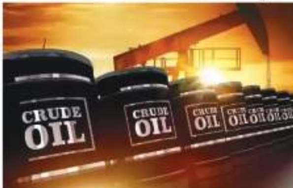
कच्चा तेल 85 डॉलर प्रति बैरल के करीब, पेट्रोल-डीजल की कीमत स्थिर

इंडियन ऑयल की वेबसाइट के मुताबिक राजधानी दिल्ली में पेट्रोल 96.72 रुपये, डीजल 89.62 रुपये, मुंबई में पेट्रोल 106.31 रुपये, डीजल 94.27 रुपये, कोलकाता में पेट्रोल 106.03 रुपये, डीजल 92.76 रुपये, चेन्नई में पेट्रोल 102.63 रुपये और डीजल 94.24 रुपये प्रति लीटर की दर पर उपलब्ध है। अंतरराष्ट्रीय बाजार में हफ्ते साब 84.89 डॉलर प्रति बैरल पर टिका है। वहीं, वेस्ट टेक्सस इंटरमीडियट (डब्ल्यूटीआई) साब 84.89 डॉलर प्रति बैरल पर टिका है। वहीं, वेस्ट टेक्सस इंटरमीडियट (डब्ल्यूटीआई) साब 84.89 डॉलर प्रति बैरल पर टिका है। वहीं, वेस्ट टेक्सस इंटरमीडियट (डब्ल्यूटीआई) साब 84.89 डॉलर प्रति बैरल पर टिका है।