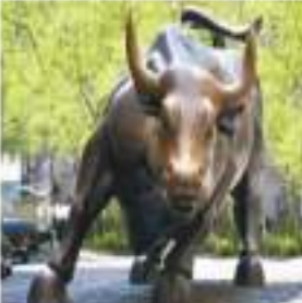
आज के कारोबार का अंत किया। आज बाजार की तेजी के कारण स्टॉक मार्केट के निवेशकों को हुआ 1.93 लाख करोड़ का मुनाफा

नई दिल्ली। घरेलू शेयर बाजार आज लगातार दूसरे दिन मजबूती के साथ कारोबार करने के बाद बंद हुआ। आज के कारोबार की शुरुआत मजबूती के साथ हुई थी, लेकिन पूरे दिन लिक्विडिटी और बिकवालों के बीच खींचतान चलती रही। हालांकि लिक्विडिटी का जोर अधिक होने की वजह से बाजार के सूचकांक लगातार हरे निशान में कारोबार करते रहे। दिनभर के कारोबार के बाद सेंसेक्स 0.44 प्रतिशत और निफ्टी 0.51 प्रतिशत की मजबूती के साथ बंद हुए।